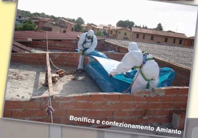
Bonifica e confezionamento Amianto