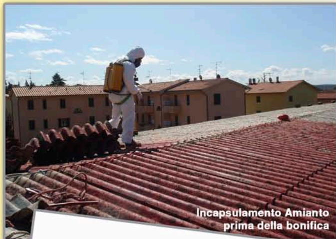
Incapsulamento Amianto prima della bonifica

La forma più diffusa di materiali contenenti amianto sono le lastre di ETERNIT da copertura che vanno fatte rimuovere da ditte specializzate e dotate di iscrizione all'albo nazionale gestori ambientali come la nostra. Tale iscrizione, oltre che obbligatoria per chi rimuove o manipola M.C.A., è garanzia dell'uso delle tecniche e di accorgimenti necessari affinché durante le rimozioni non vi siano dispersioni di fibre nocive. Siamo in grado di rimuovere tutti i materiali contenenti amianto come piccole tettoie, canne fumarie, depositi dell'acqua sino alle grandi coperture industriali. I nostri preventivi e sopralluoghi sono sempre gratuiti e senza impegno.