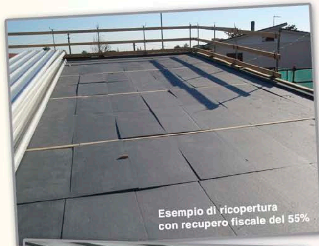
Esempio di ricopertura con recupero fiscale del 55%