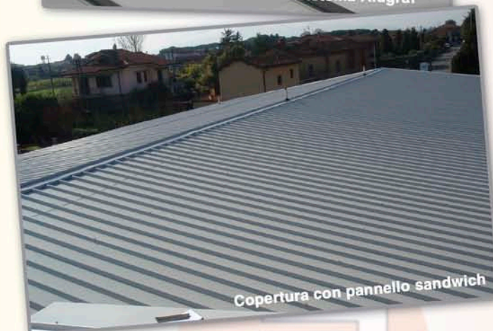
Copertura con pannello sandwich