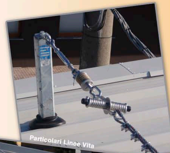
Particolari Linee Vita

La specializzazione nella rimozione dei materiali contenenti amianto (in particolare le lastre di Eternit) ci ha portato ad affrontare anche il problema della ricopertura, quindi dopo le rimozioni, siamo in grado di effettuare ricoperture del tetto sia con materiali tradizionali che con lastre metalliche. Nell'ultimo anno questa pratica si è molto diffusa grazie all'incentivo fiscale del 55% ottenibile con la riqualificazione energetica dell'edificio, sia civile che industriale. La ricopertura comprende anche la sistemazione di sistemi anticaduta, le cosiddette LINEE VITA, che possiamo sia su tetti nuovi che su tetti già esistenti sui quali viene installato l'impianto fotovoltaico.